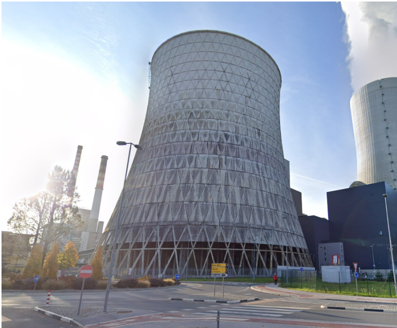
Skica 2: fotografija HSB4.

Zemljišče v lasti TEŠ (ID znak: parcela 959 1227), ki je predvideno za najem, se nahaja znotraj energetske lokacije TEŠ. Namenska raba zemljišča opredeljuje, da se parcela 959 1227 nahaja na območju energetske infrastrukture (E).