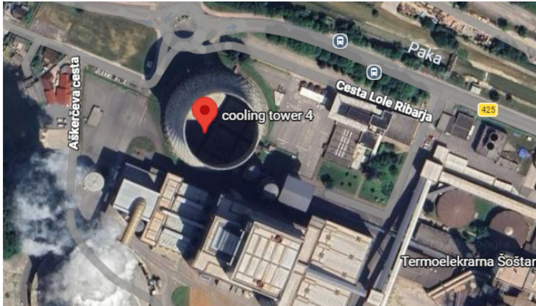
Skica 3: fotografija HSB4 znotraj energetske infrastrukture.